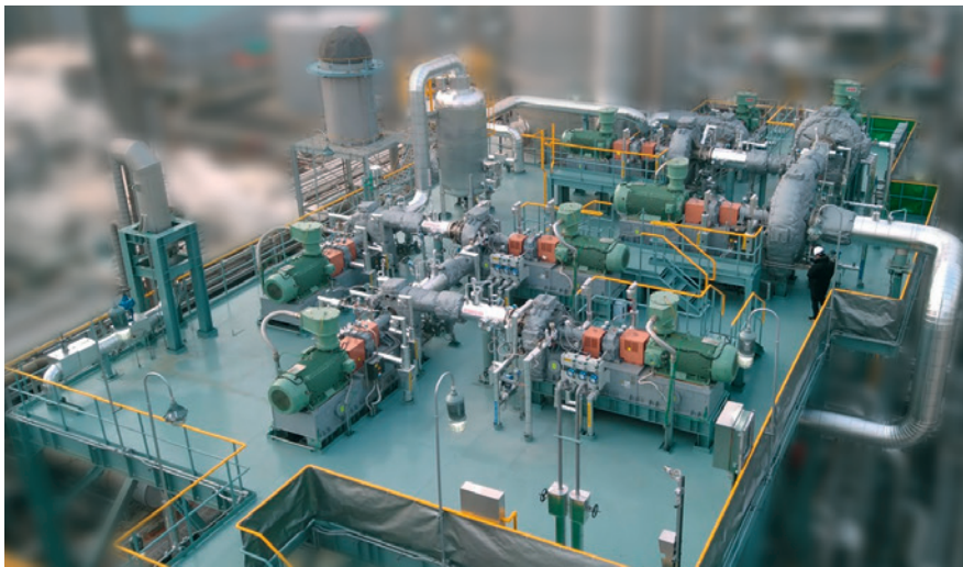
Sistema mecánico de compresión de vapor para una bomba de calor de alta temperatura

Con más de una docena de instalaciones, hemos consolidado nuestra posición como pioneros en bombas de calor generadoras de vapor a gran escala: PILLER es su experto en ahorro energético y reducción de CO 2 en los procesos químicos y petroquímicos.