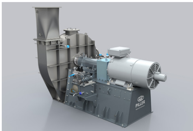
Промышленные воздуходувки PILLER используются в отраслях, где требуется большой расход воздуха при высоком давлении